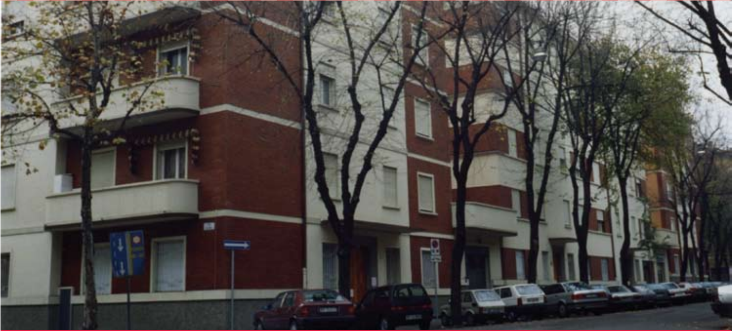
Quartiere S. Vitale - Stabile di Via Libia angolo Via Palmieri